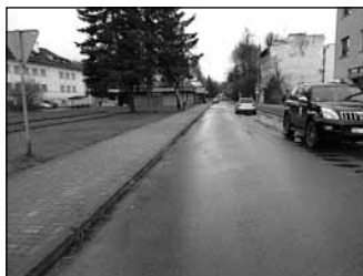
ul. 1 Maja